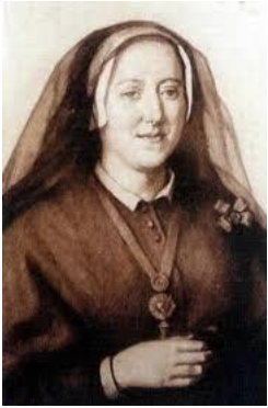
św. Maria Michalina od Najświętszego Sakramentu

Urodziła się 1 stycznia 1809 r. w Madrycie w zamożnej, szlacheckiej rodzinie. Od młodości poświęciła się działalności charytatywnej wśród chorych. Miała talenty artystyczne - malowała i grała na harfie. W 1845 r. otworzyła szkołę przeznaczoną dla kobiet porzucających prostytucję. Wiara w rzeczywistą obecność Chrystusa w Najświętszym Sakramencie prowadziła ją do niezachwianej pewności, że o cokolwiek będzie Chrystusa prosić - otrzyma. Za radą kierownika duchowego założyła zgromadzenie zakonne. W 1856 r. powstało zgromadzenie Sióstr Służebnic Adoratorek Najświętszego Sakramentu i Miłosierdzia, a Maria została wybrana jego przełożoną generalną. Przyjęła imię Marii Michaliny od Najświętszego Sakramentu. Wkrótce domy nowego zgromadzenia powstały w Saragossie, Walencji, Barcelonie,